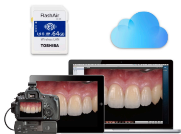
「写真を撮るだけで、iPad、PCへと自動的に転送」